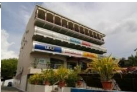
キャッシングセンター