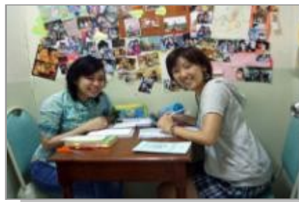
マンツーマン講義室*