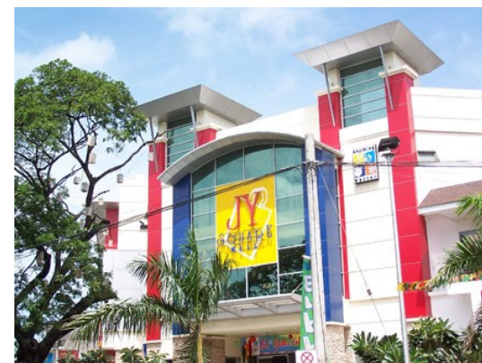
〈JY スクエア モール〉