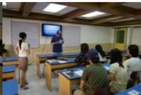
グループ授業風景