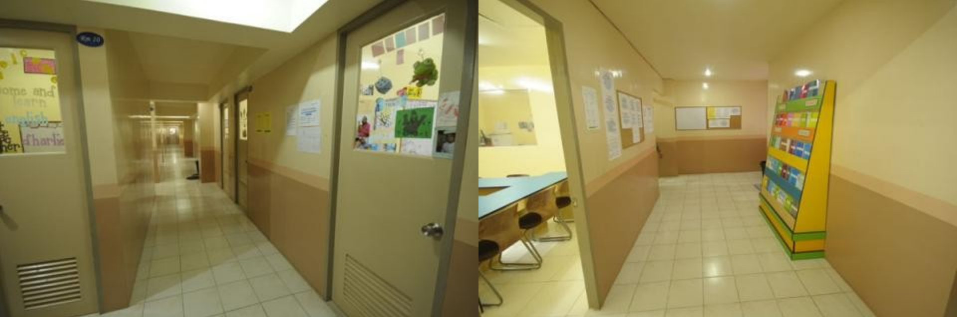
＜大学校舎内にある講義室＞