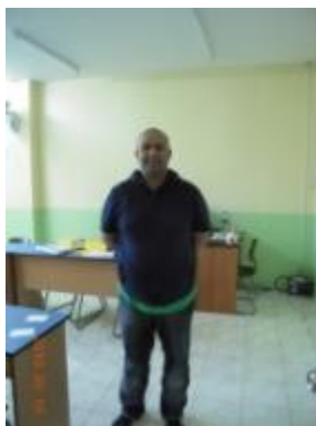
ビジネスクラスも担当するネイティブ講師